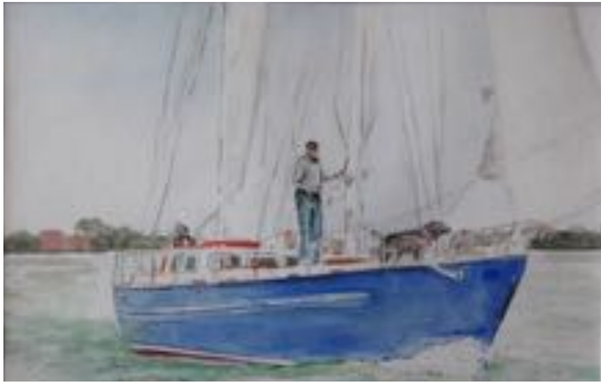
Waterverftekening van de Brandaan