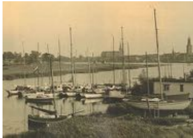
Oude opname van de werf Kroes te Kampen

Mooi weer in september. In plaats van naar de boot met partner naar de Veluwe geweest om te recreëren. Ik had beloofd helemaal niets met water of bootjes te regelen, overmacht voorbehouden, om rustig in het groene lover te wandelen en een nachtje door te brengen in een B&B.