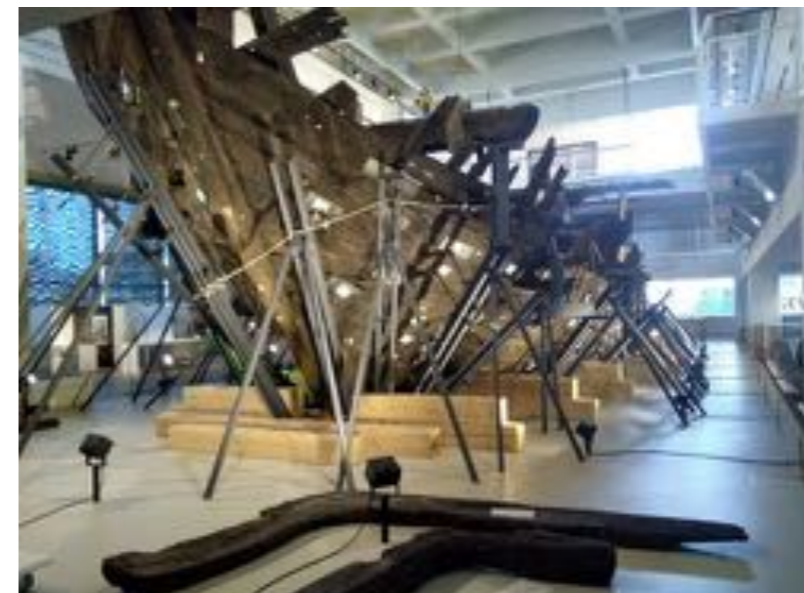
De Bremer kogge in de tentoonstelling. Met teksten, beelden en computeranimaties worden de resultaten van het wetenschappelijk onderzoek naar de bouw, constructie en het varen met de kogge uitgelegd.

Bij de aanleg van een nieuwe zeehaven bij Bremerhaven stuitte men op 8 oktober 1962 toevallig op een houten scheepswrak.