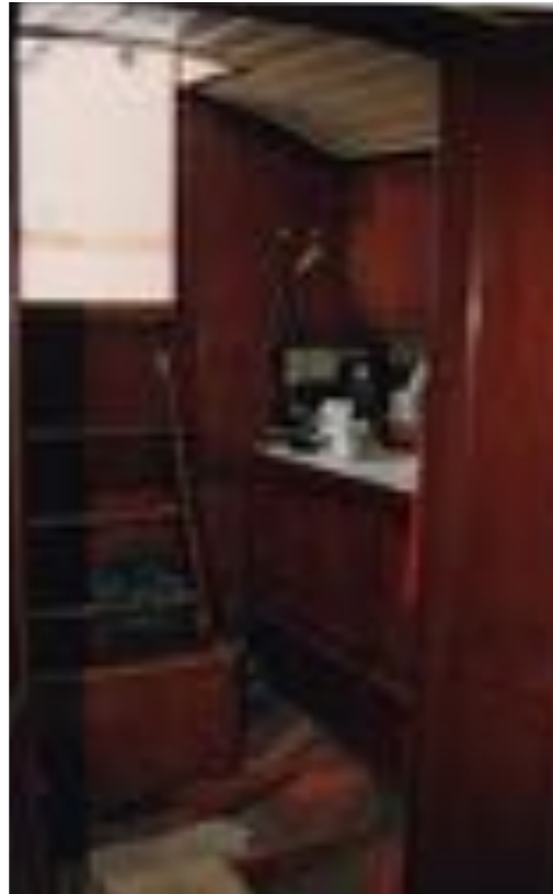
Boven: interieur van de Ellida , voor de brand.