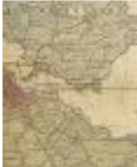
Topografische kaart 1850-1865. De Oranjesluizen zijn nog niet aangelegd.