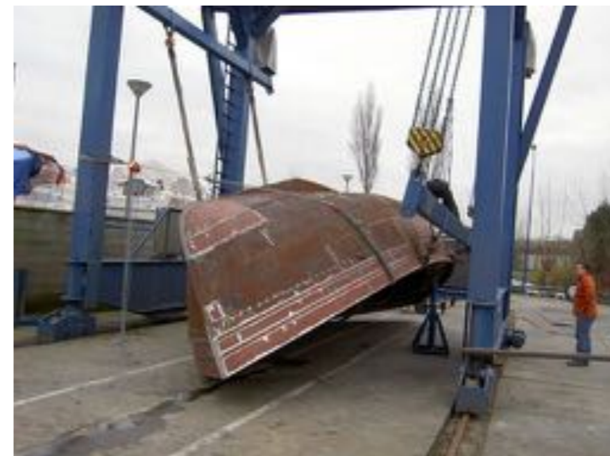
Links: De Ellida na stralen en schilderen; rechts: in de kraan na de voltooiing van het staalwerk.